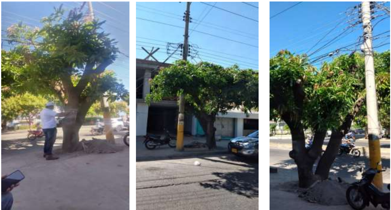
Árbol a intervenir por tala, árbol de la especie de mango nombre común, ( Mangifera Indica ) nombre científico, ubicado en la Calle 16 No 19 D-15 barrio Jorge Dangond de Valledupar – Cesar.