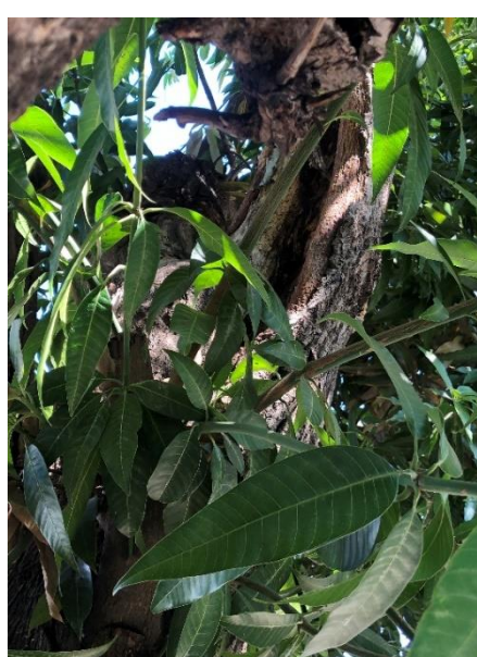
Fig No 5. Cavidades necróticas