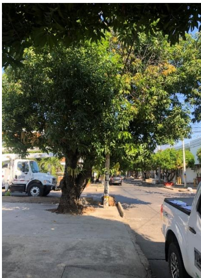
Fig No 1. Árbol de especie Mango ( Mangifera indica )