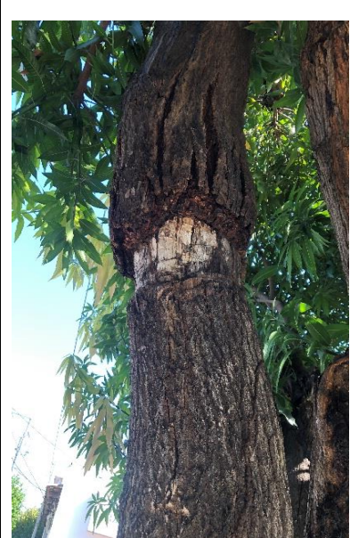
Fig No 6. Tallo seco