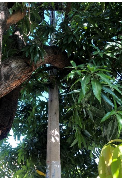
Fig No 4. Distancia de 1.40 m del poste de líneas telefónicas.