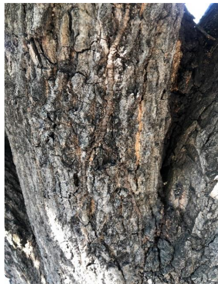
Fig No 2. Plaga denominada Comején