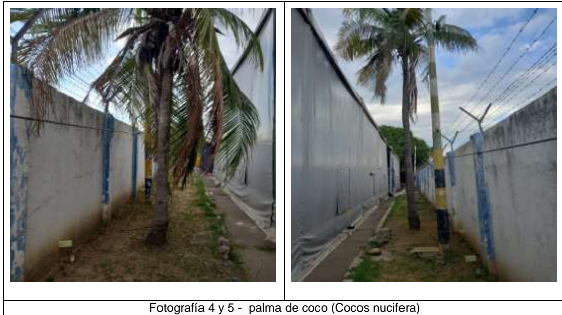
Fotografía 4 y 5 - palma de coco (Cocos nucifera)

Continuación Resolución No 0031 de 07 MAR 2022 "Por medio de la cual se otorga autorización a GASEOSAS LUX S.A.S, con identificación tributaria número 860-001.697 - 8, para realizar aprovechamiento forestal consistente en tala de cinco (5) árboles aislados en centro urbano, ubicados en la Cra 7A N° calle 41-43 barrio panamá de Valledupar – Cesar" _____ 3