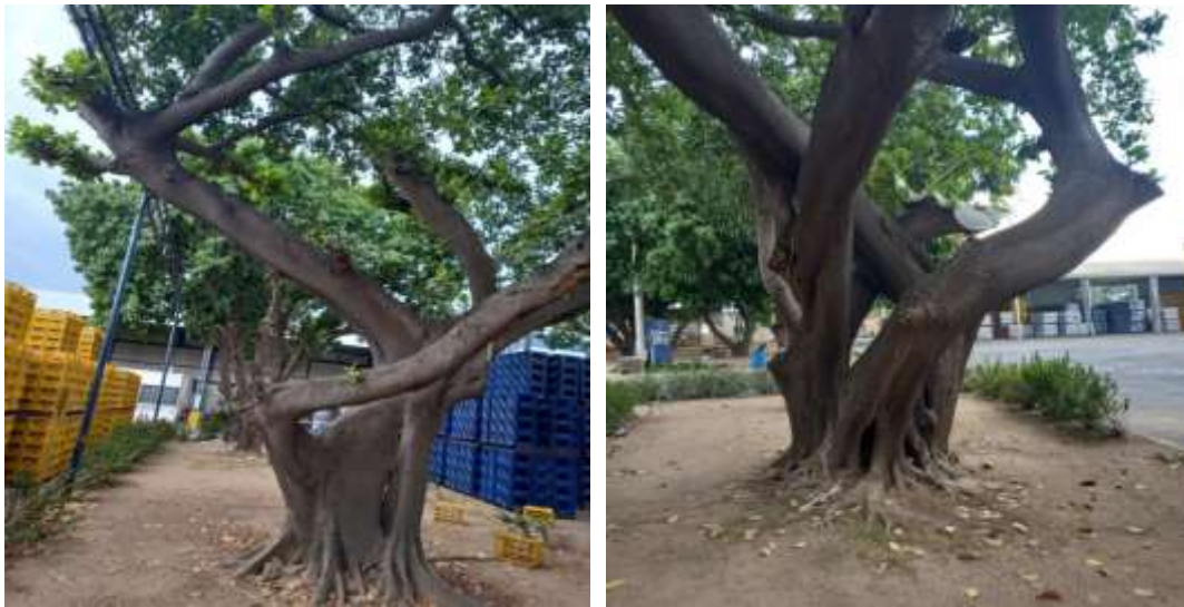
Fotografía 1 y 2 - Caucho (Hevea brasiliensis).