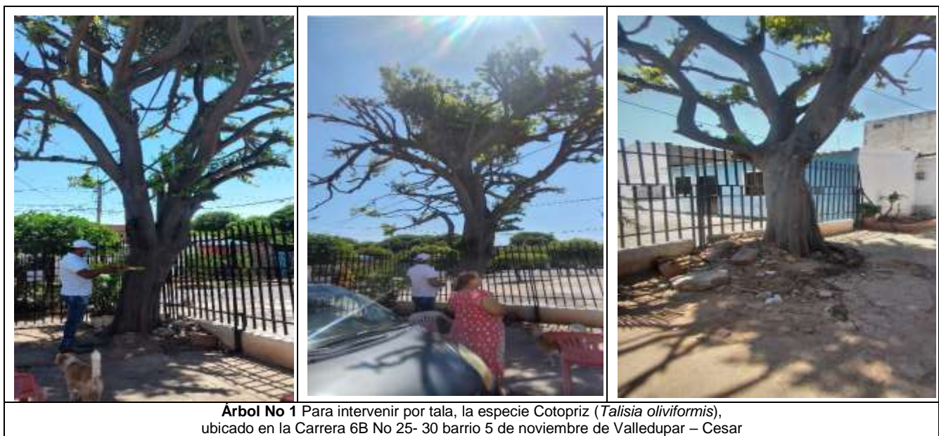
Tabla 1.- Especies y cálculo de volumen de un (1) árbol a talar Cotopriz ( Talisia oliviformis ), Ubicado en la Carrera 6B No 25- 30 barrio 5 de noviembre de Valledupar – Cesar