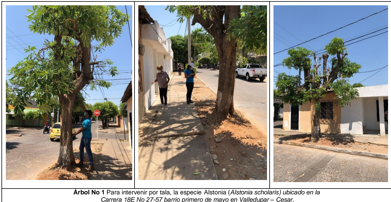
Tabla 1.- Especies y cálculo de volumen de un (1) árbol a talar de la especie Alstonia ( Alstonia scholaris ) ubicado en la Carrera 18E No 27-57 barrio primero de mayo en Valledupar – Cesar.