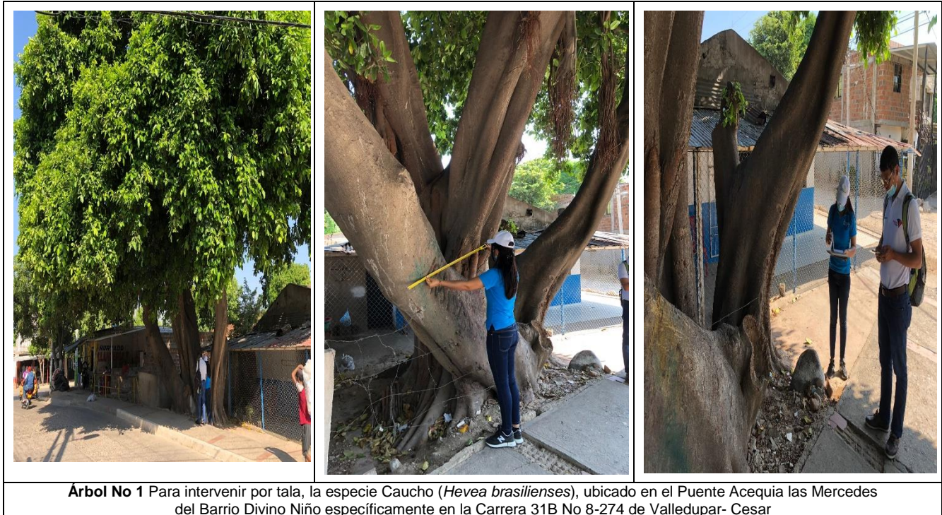
Tabla 1.- Especies y cálculo de volumen de un (1) árbol a talar de la especie Caucho ( Hevea brasilienses ), ubicado en el Puente Acequia las Mercedes del Barrio Divino Niño específicamente en la Carrera 31B No 8-274 de Valledupar- Cesar