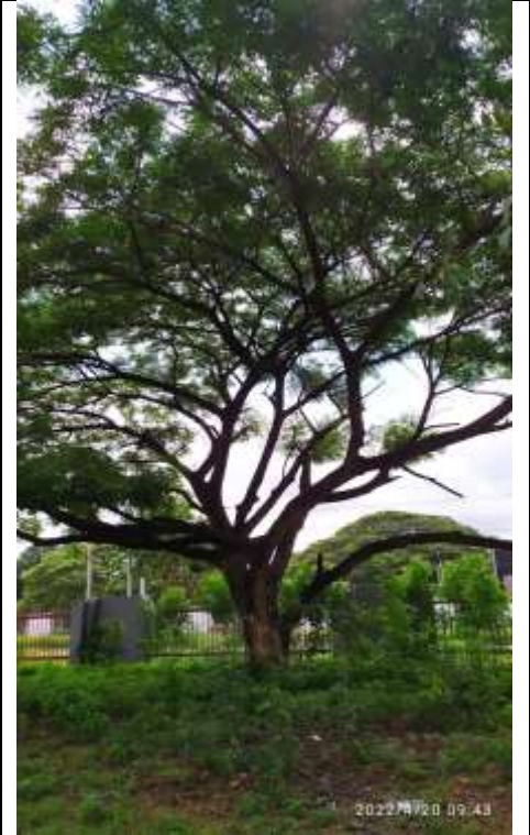
Árbol No 6 Samanea Saman