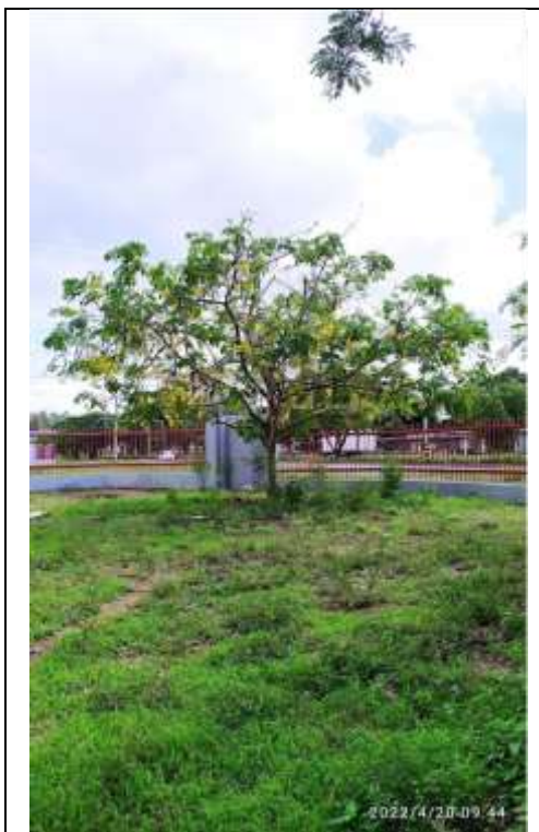
Árbol No 7 Cassia fistula