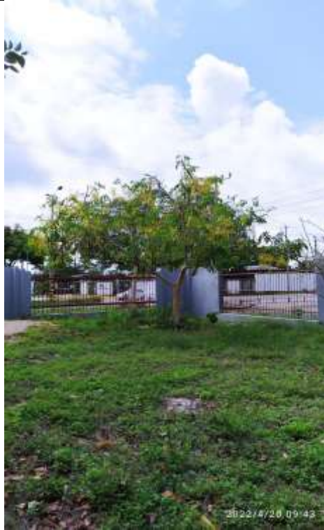
Árbol No 5 Cassia fistula