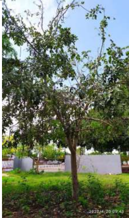
Árbol No 4 Cassia fistula

Continuación Resolución No 0050 de 10 MAY 2022 "Por medio de la cual se otorga autorización a DISTRIBUCIONES SANTA MARTA , con identificación tributaria número 900.026.211-5, para realizar aprovechamiento forestal consistente en tala de siete (7) árboles aislados en centro urbano, ubicados en la Carrera 18D # 65 – 206, lote 13 Mz C de Valledupar – Cesar" _ _ _ _ _ 3