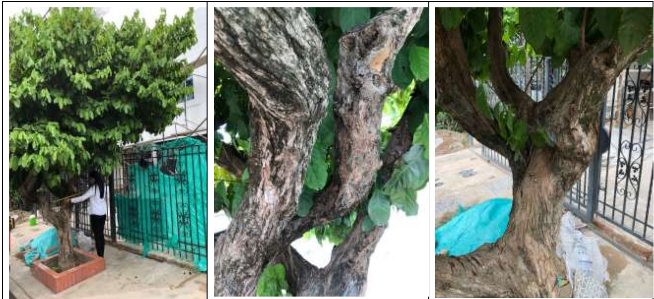
Árbol No 1. Para intervenir por tala, la especie Maíz Tostao ( Coccoloba acuminata ), ubicado en la Cra 17 No 13C-56 Barrio Alfonso López Valledupar-Cesar.