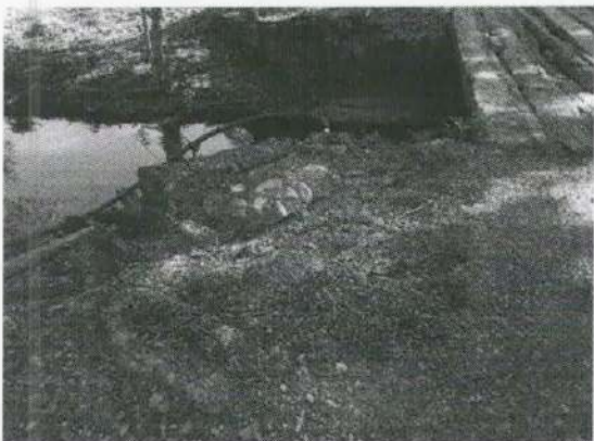
Imagen 12. Enraizamiento del árbol evaluado en el barranco del río.