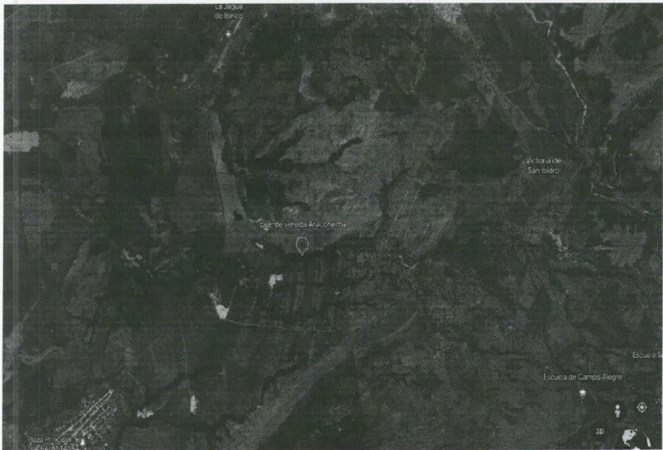
Imagen 1. Ubicación del árbol evaluado en Google Earth, asociado al puente en la vereda Aracoraima

El espécimen que se referencia pertenece a la especie Orejero ( Enterolobium Cyclocarpum ) y a continuación se aporta evidencia fotográfica tanto del árbol como del puente: