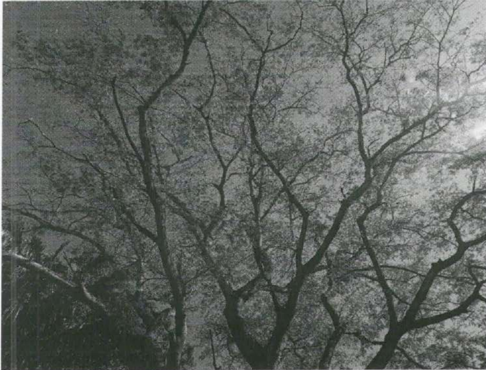
Imagen 6. Ramazón del árbol evaluado