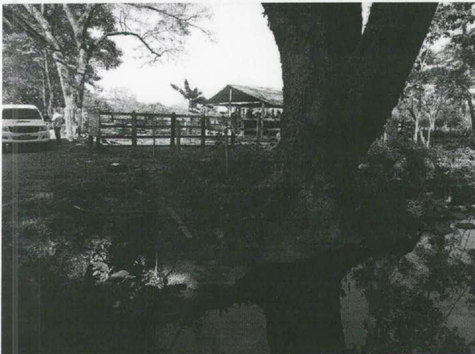
Imagen 7. Ubicación del árbol evaluado a la orilla del río