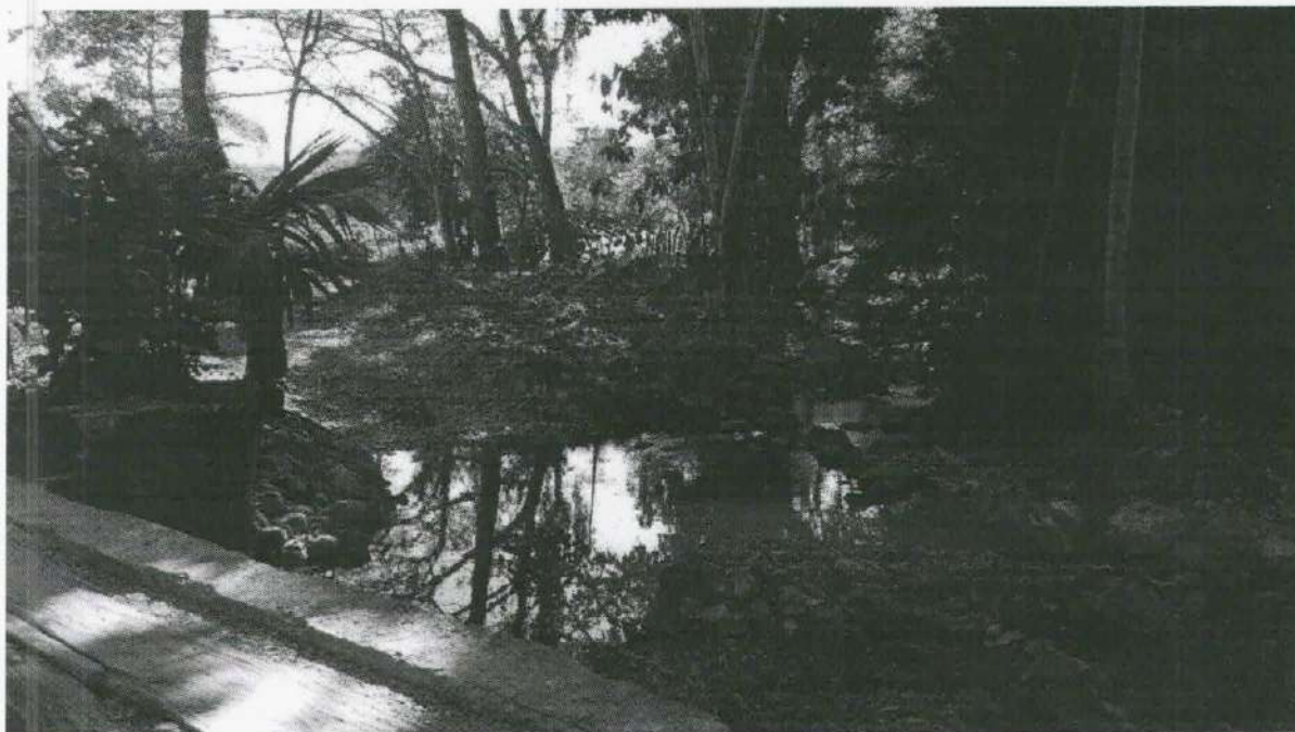
Imagen 4. Lecho del rio San Antonio resguardado por árboles que evitan la erosión.