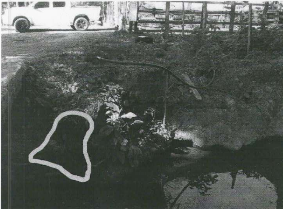
Imagen 9. Ubicación de la afectación provocada por el árbol evaluado