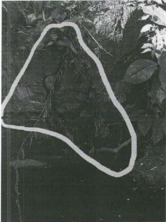
Imagen 8. Daño causado por las raíces del árbol evaluado a la estructura base del puente