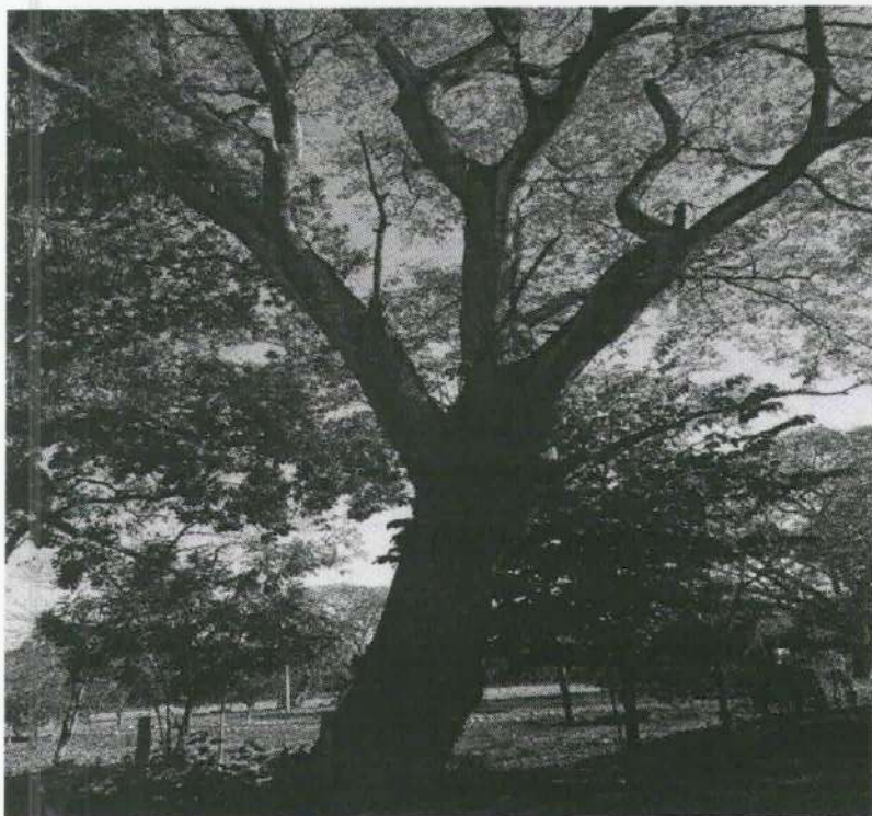
Imagen 5. Árbol evaluado