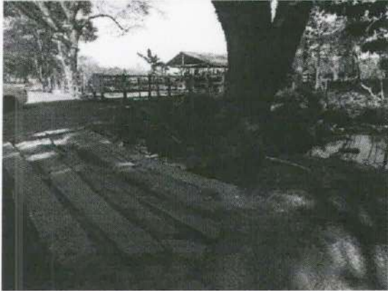
Imagen 10. Ubicación del puente justo en la parte de arriba del árbol evaluado