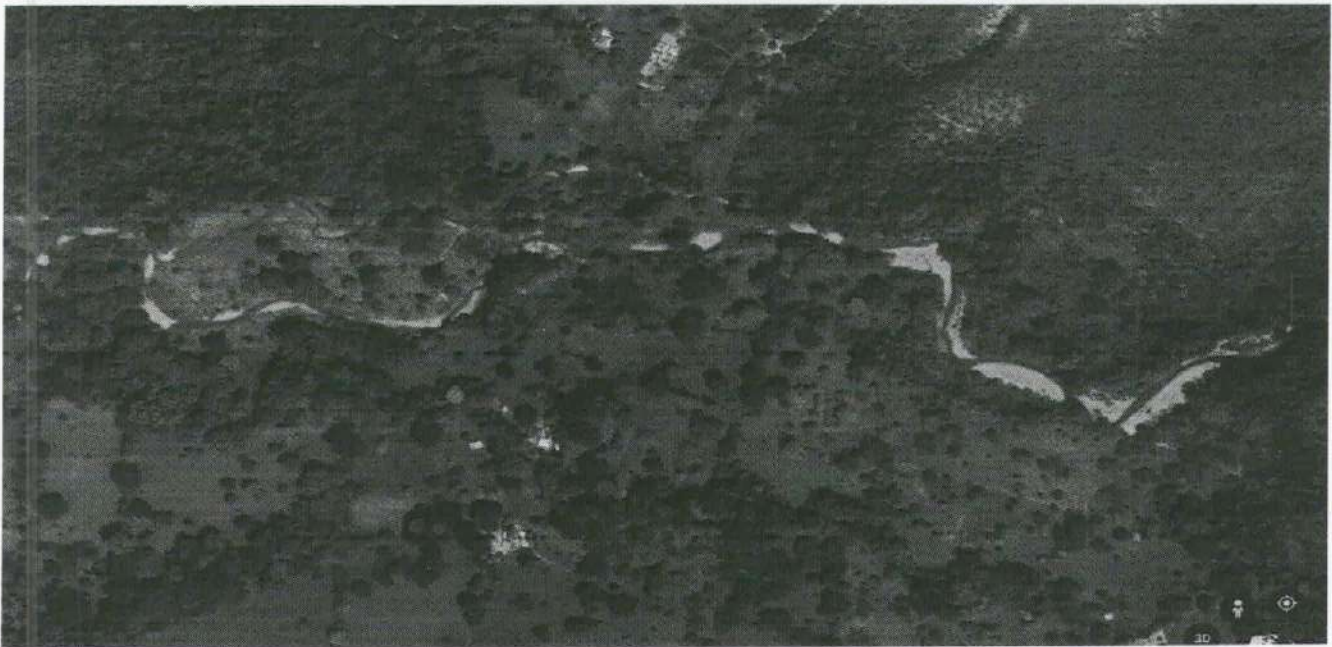
Imagen 3. Ilustración del comportamiento del rio San Antonio en zonas deforestadas. Obsérvese cómo se amplía el cauce en zona deforestada.