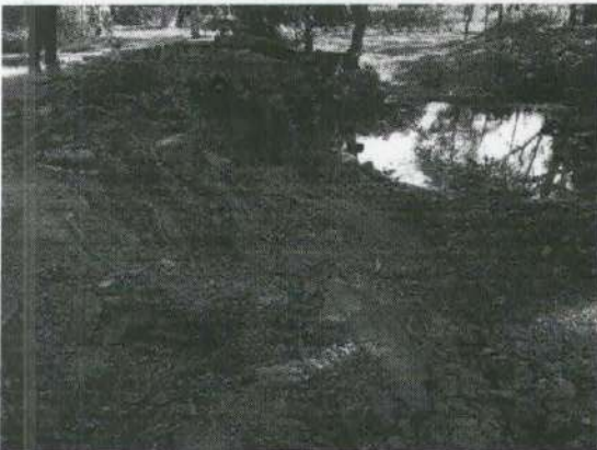
Imagen 11. Enraizamiento del árbol evaluado en el barranco que respalda al puente