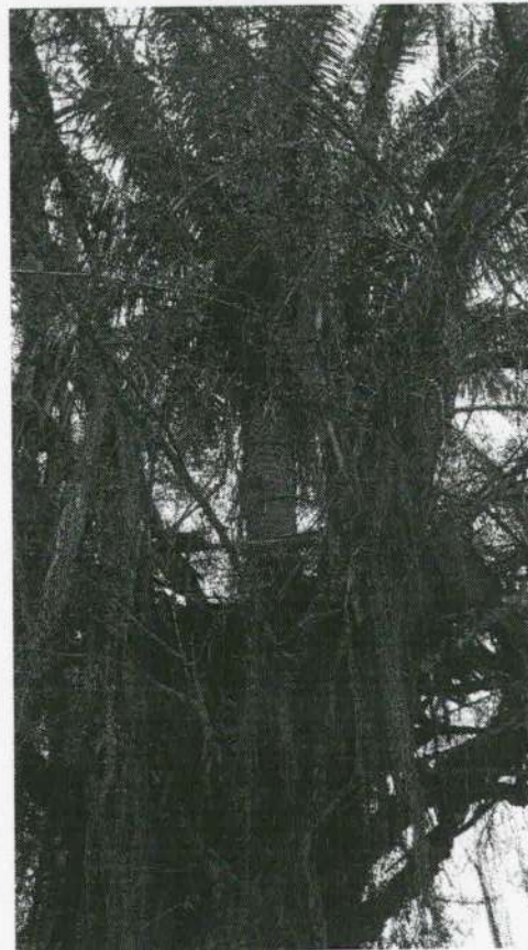
Imagen 6: simbiosis de los dos especímenes evaluados.