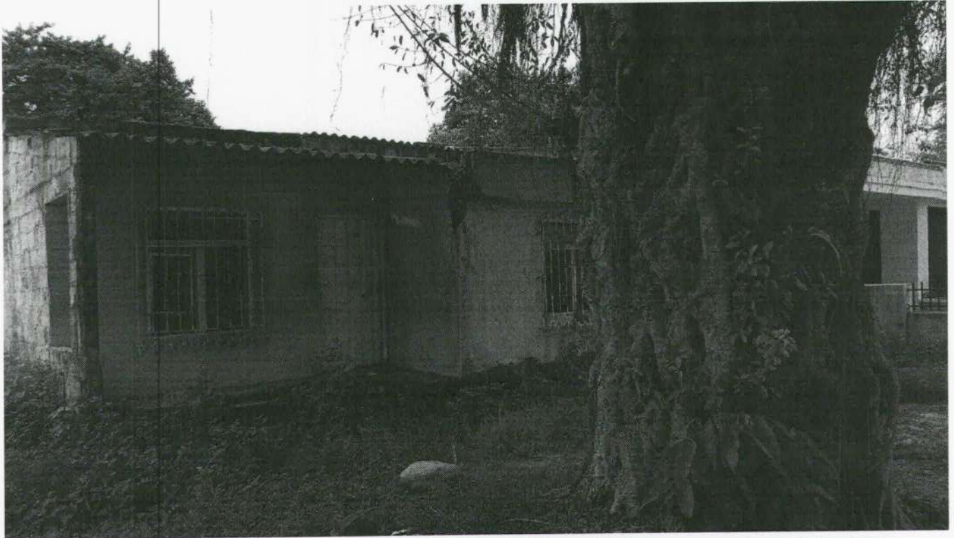
Imagen 5: vivienda en estado de abandono con múltiples afectaciones en pisos, tuberías y paredes.