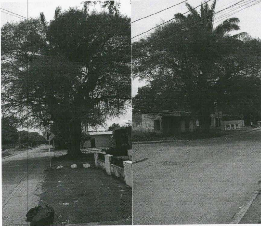
Imagen 2 y 3. Vista panorámica de la ubicación de los arboles evaluados desde dos ángulos.