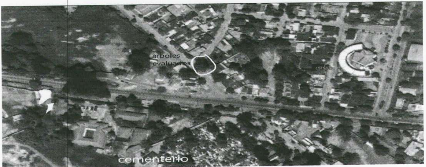
Imagen 1. Ubicación de los árboles evaluados en Google Earth.

Se realiza visita el día 14 de julio de 2023 en compañía de una funcionaria de la Alcaldía para evaluar la situación descrita en la solicitud de aprovechamiento forestal con el fin de emitir concepto técnico determinando la viabilidad del requerimiento de intervención forestal a un (1) árbol aislado fuera de la cobertura de bosque natural en terrenos de dominio público a cuya ubicación corresponden las siguientes coordenadas: Lat N 9°.33'48.182" / Long O -73°.20'26.839". Se pudo establecer que realmente existe afectación de las raíces del árbol a las viviendas del sector, dado que los árboles del género Ficus son portadores de un sistema radicular fuerte y muy extendido, llegando a medir treinta metros o más de longitud. Para el caso de la vivienda en cuyo frente se encuentra este árbol, es tal su deterioro, que se hace necesario reemplazar pisos, tuberías y algunas paredes. También se observó que, aunque la petición fue formulada para aprovechamiento forestal de un árbol de la especie Ficus Pertusa, en realidad existe una relación simbiótica del mismo con otro individuo de la especie palma (Attalea Butyracea), de modo que son dos los especímenes valorados en el presente informe tomados como uno solo al momento de calcular el volumen de madera aprovechada, pues el árbol del género Ficus se encuentra rodeando el tallo de la palma hasta una altura aproximada de 4 metros. La palma presenta un buen estado fitosanitario y buen estado de desarrollo.