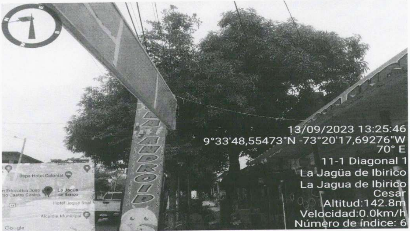
Imagen 3. Árbol Mango ( Mangifera indica ), con roce en las líneas eléctricas.

Continuación Resolución No 011 de 19 SEP 2023 Por medio de la cual se otorga permiso a La Alcaldía Municipal de La Jagua de Ibirico – Cesar, con identificación tributaria No. 800.108.683-8, para efectuar intervención forestal de poda, sobre árbol aislado, en zona urbana, ubicado en la Diagonal 1 No. 9 - 129 barrio Ovelio Jiménez, del municipio de La Jagua de Ibirico – Cesar. ----- 4