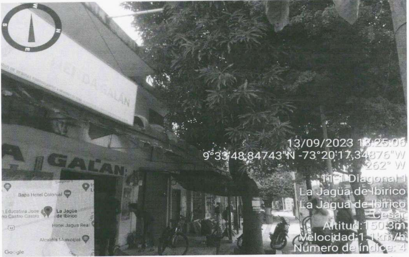
Imagen 1. Árbol Mango ( Mangifera indica ), objeto de solicitud de aprovechamiento para poda.

Continuación Resolución No 011 de 19 SEP 2023 Por medio de la cual se otorga permiso a La Alcaldía Municipal de La Jagua de Ibirico – Cesar, con identificación tributaria No. 800.108.683-8, para efectuar intervención forestal de poda, sobre árbol aislado, en zona urbana, ubicado en la Diagonal 1 No. 9 - 129 barrio Ovelio Jiménez, del municipio de La Jagua de Ibirico – Cesar. ----- 3