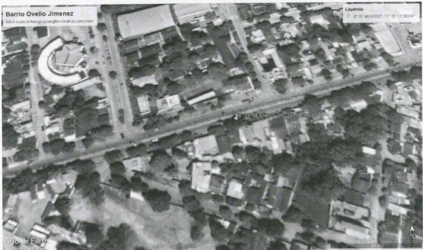
Imagen 5. Ubicación del árbol en google eart, coordenadas en la tabla 1.

Se erradicarán nueve (9) árboles de las diferentes especies; ubicado en centro urbano, parque Candelaria, jurisdicción del municipio de Becerril – Cesar, inventariados en la tabla 1.