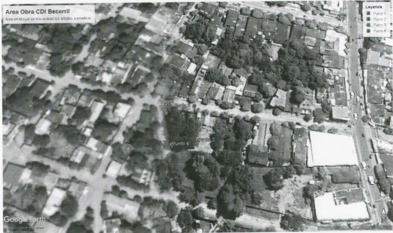
Imagen 5. Ubicación de los árboles en google eart, coordenadas en la tabla 1.

Se erradicarán veintinueve (29) árboles de diferentes especies; en la Carrera 4 entre calles 11 y 12 barrio el centro, municipio de Becerril – Cesar, inventariados en la tabla 1.