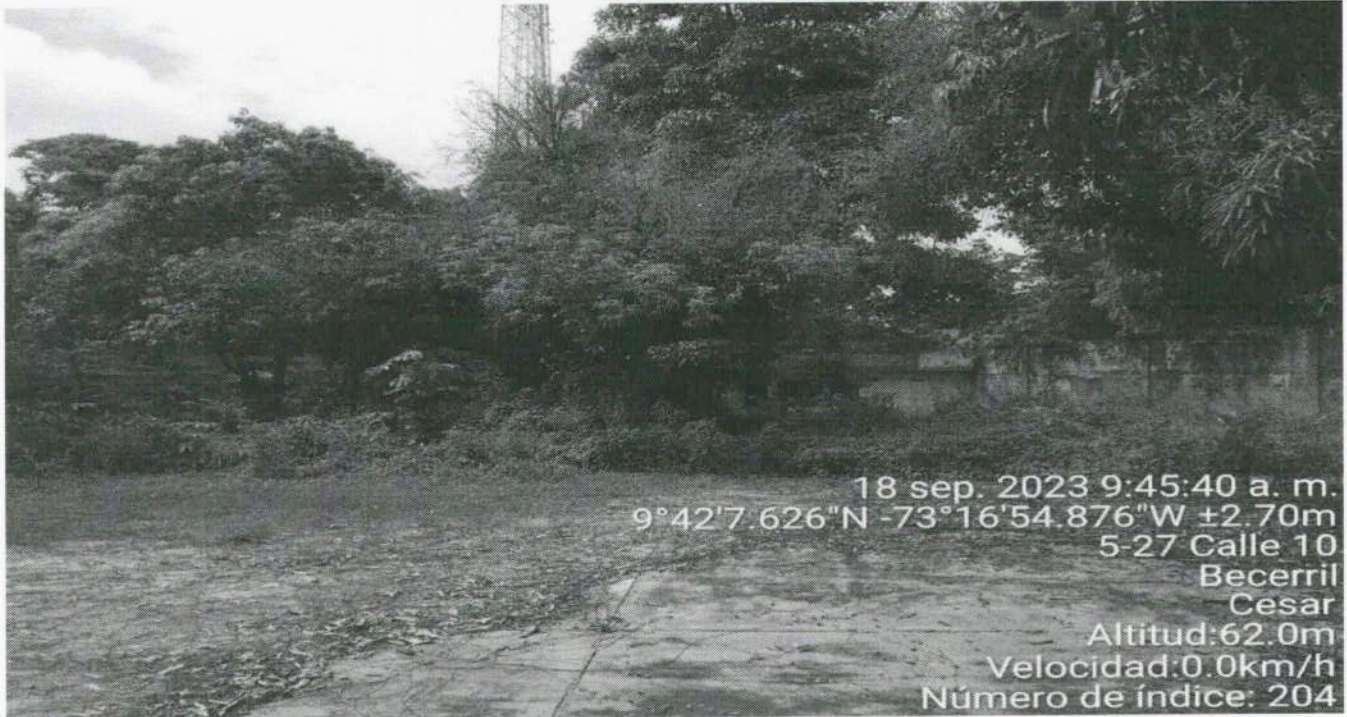
Imagen 3. Árbol Mango ( Mangifera indica ), Roble ( Quercus robur ) y Nispero ( Eriobotrya japonica ), objeto de solicitud de aprovechamiento forestal