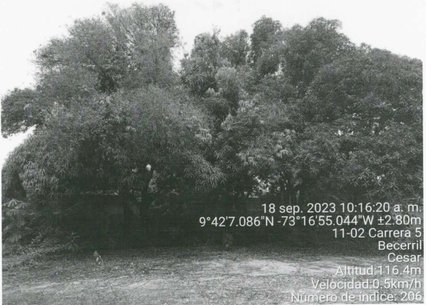
Imagen 1. Árboles Mango ( Mangifera indica ), objeto de solicitud de aprovechamiento forestal.

de obra denominado "CONSTRUCCIÓN DEL CENTRO DE DESARROLLO INFANTIL LOS PINITOS EN EL MUNICIPIO DE BECERRIL DEPARTAMENTO DEL CESAR.", los cuales deben ser erradicados; sus respectivas ubicaciones estarán especificadas en la tabla del inventario forestal: