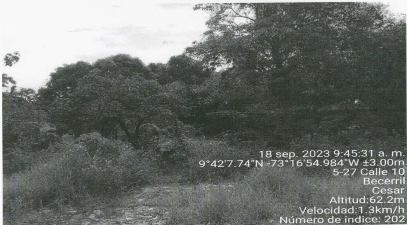
Imagen 4. Árbol Mango ( Mangifera indica ), Roble ( Quercus robur ), Limón ( Citrus limón ), objeto de solicitud de aprovechamiento forestal.