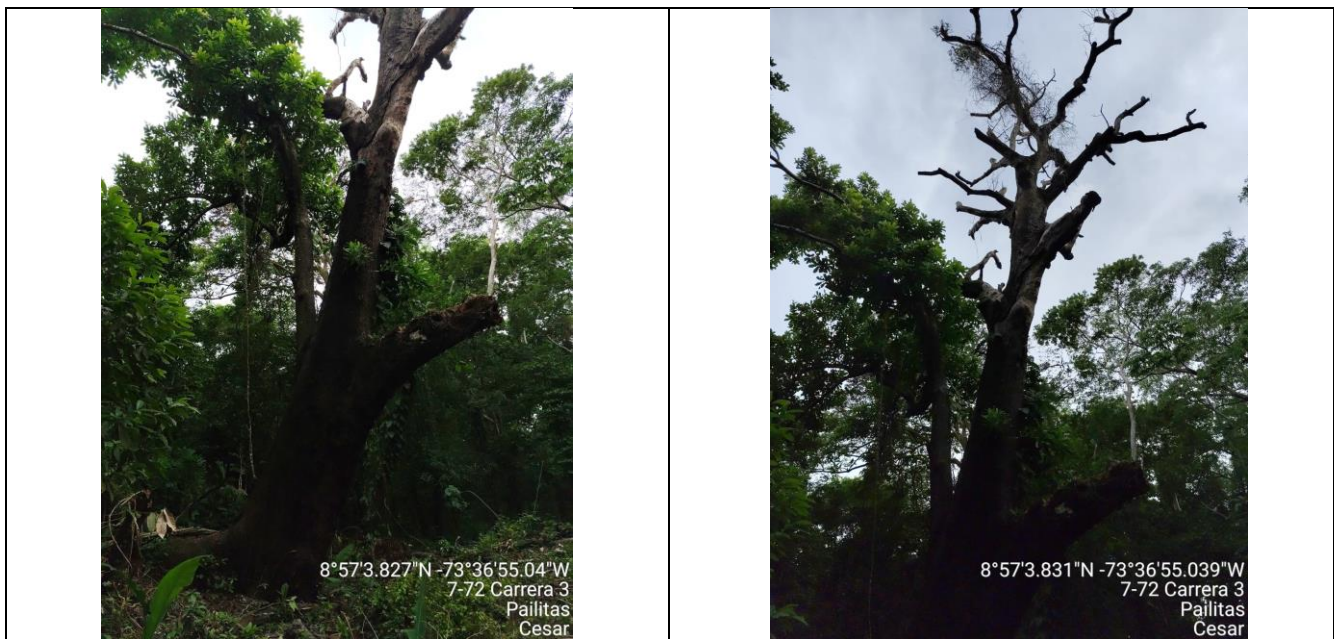
Fotografía 1, 2 árbol de la especie Caracolí ( Anacardium excelsum ), ubicado en el predio denominado "Los Dos Potrillos" zona rural jurisdicción del Municipio de Pailitas – Cesar.

Es de anotar que, predominaba una densidad del dosel de árboles frondosos con más del 40 por ciento del suelo ocupado por su proyección perpendicular de la vegetación. Finalmente, se observó presencia de Brinzales y Latizales en la parte más baja del bosque. Estando en el sitio se verificó la existencia de un (1) árbol de la especie comúnmente conocida como Caracolí ( Anacardium excelsum ), el cual se encuentra con problemas físicos y fitosanitarios y regeneración natural, este árbol aislado se encuentra fuera de la cobertura de bosque natural y que por razones de orden fitosanitario requiere ser talado y su producto será usado con fines comerciales, por lo que es viable su aprovechamiento.