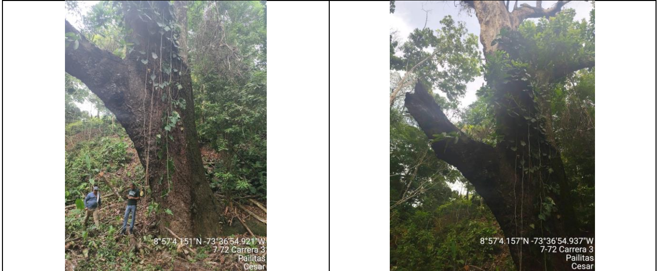
Fotografía 3 y 4 árbol de la especie Caracolí ( Anacardium excelsium ), ubicado en el predio denominado "Los Dos Potrillos" zona rural jurisdicción del Municipio de Pailitas – Cesar.