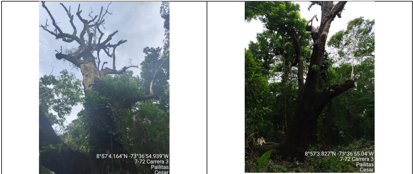
Fotografía 5 y 6 árbol de la especie Caracolí ( Anacardium excelsium ), ubicado en el predio denominado "Los Dos Potrillos" zona rural jurisdicción del Municipio de Pailitas – Cesar.