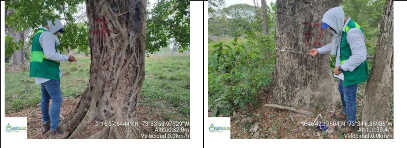
Fotografía 17 y 18 árboles de la especie Campano (Samanea Samán), ubicado en la Finca Parcela 18 ubicado en la vereda Nueva Granada en jurisdicción del Municipio de Curumani – Cesar.