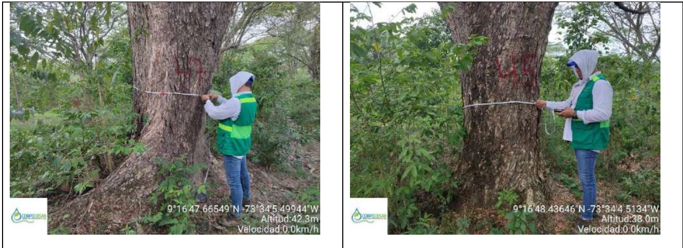
Fotografía 13 y 14 árboles de la especie Campano ( Samanea Samán ), ubicado en la Finca Parcela 18 ubicado en la vereda Nueva Granada en jurisdicción del Municipio de Curumani – Cesar.