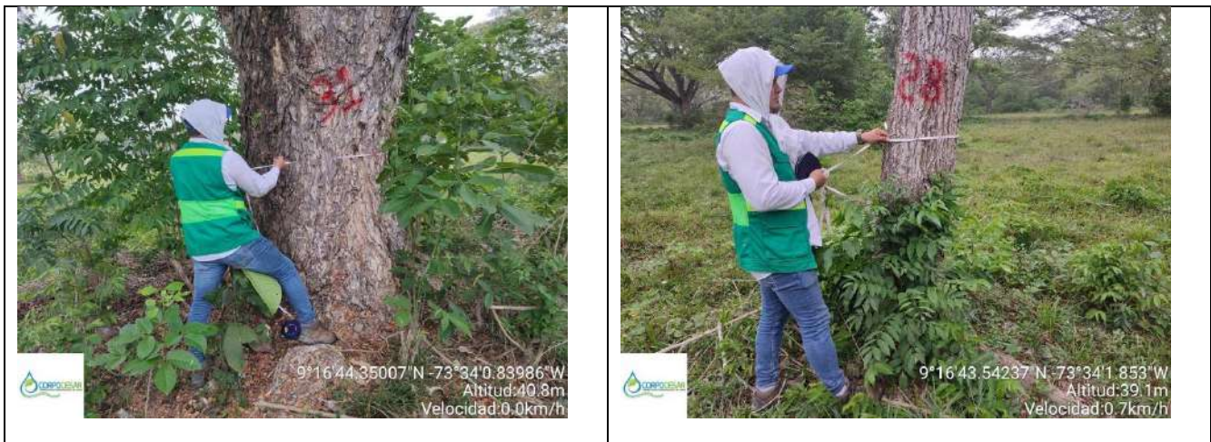
Fotografía 1 y 2 árboles de la especie Campano ( Samanea Samán ), ubicado en la Finca Parcela 18 ubicado en la vereda Nueva Granada en jurisdicción del Municipio de Curumani – Cesar.