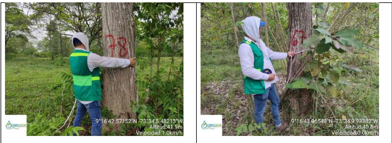
Fotografía 11 y 12 árboles de la especie Roble (Tabebuia rosea), ubicado en la Finca Parcela 18 ubicado en la vereda Nueva Granada en jurisdicción del Municipio de Curumani – Cesar.