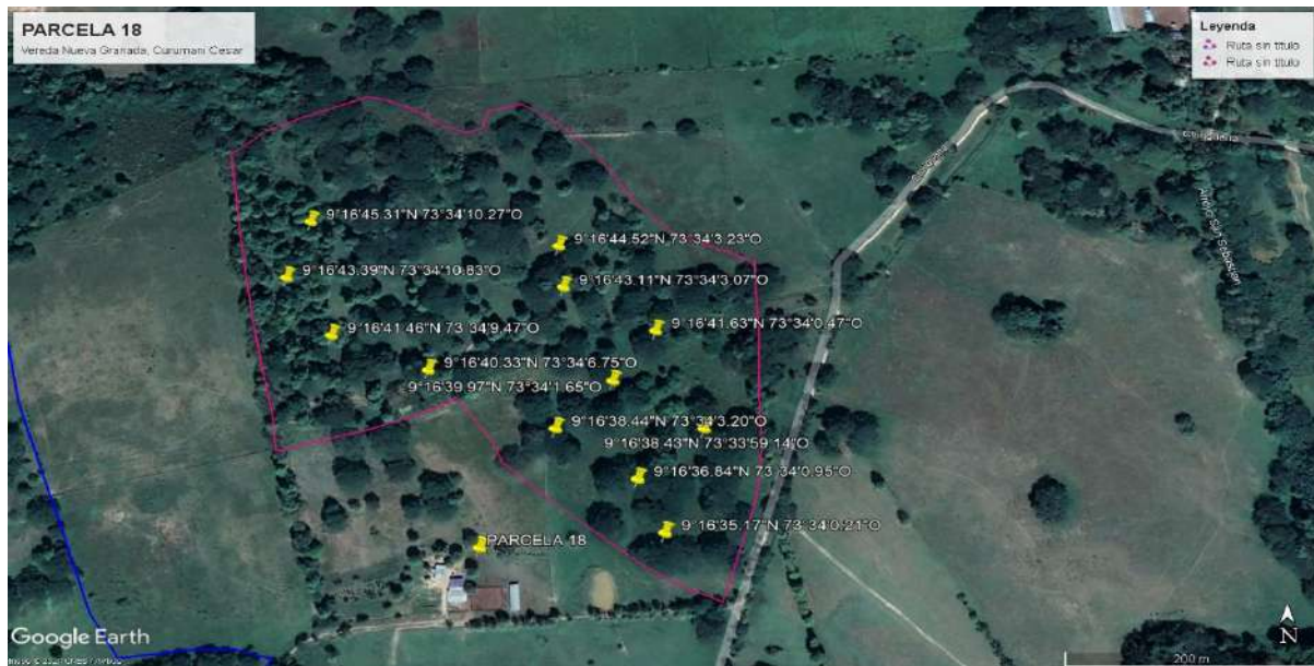
Imagen 1 Predio Parcela 18