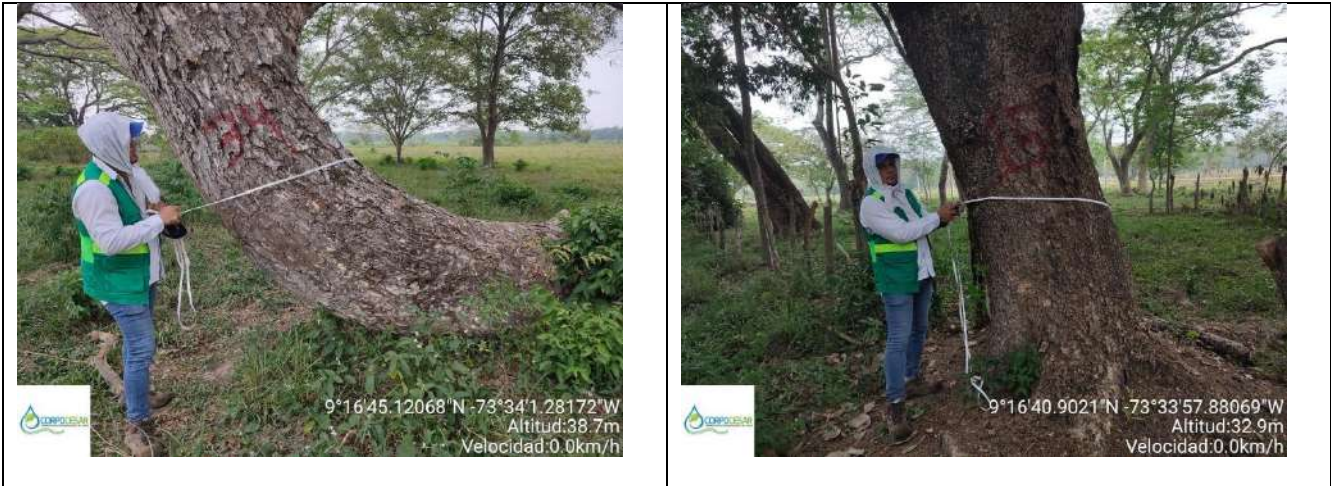
Fotografía 21 y 22 árboles de la especie Campano (Samanea Samán), ubicado en la Finca Parcela 18 ubicado en la vereda Nueva Granada en jurisdicción del Municipio de Curumani – Cesar.