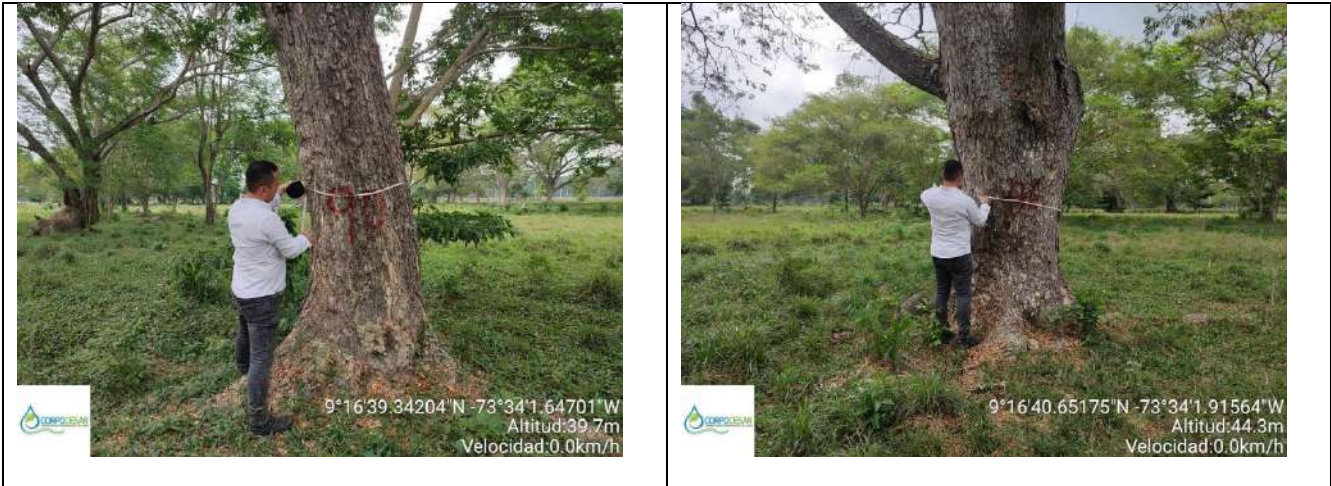
Fotografía 9 y 10 árboles de la especie Campano (Samanea Samán), ubicado en la Finca Parcela 18 ubicado en la vereda Nueva Granada en jurisdicción del Municipio de Curumani – Cesar.