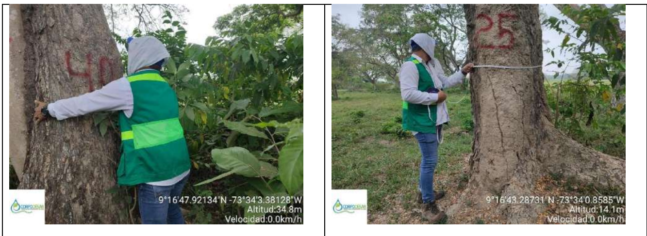
Fotografía 15 y 16 árboles de la especie Campano ( Samanea Samán ), ubicado en la Finca Parcela 18 ubicado en la vereda Nueva Granada en jurisdicción del Municipio de Curumani – Cesar.