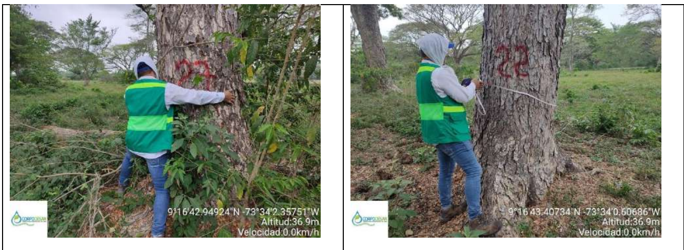
Fotografía 3 y 4 árboles de la especie Campano ( Samanea Samán ), ubicado en la Finca Parcela 18 ubicado en la vereda Nueva Granada en jurisdicción del Municipio de Curumani – Cesar.