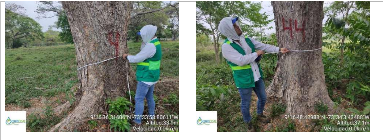
Fotografía 23 y 24 árboles de la especie Campano (Samanea Samán), ubicado en la Finca Parcela 18 ubicado en la vereda Nueva Granada en jurisdicción del Municipio de Curumani – Cesar.