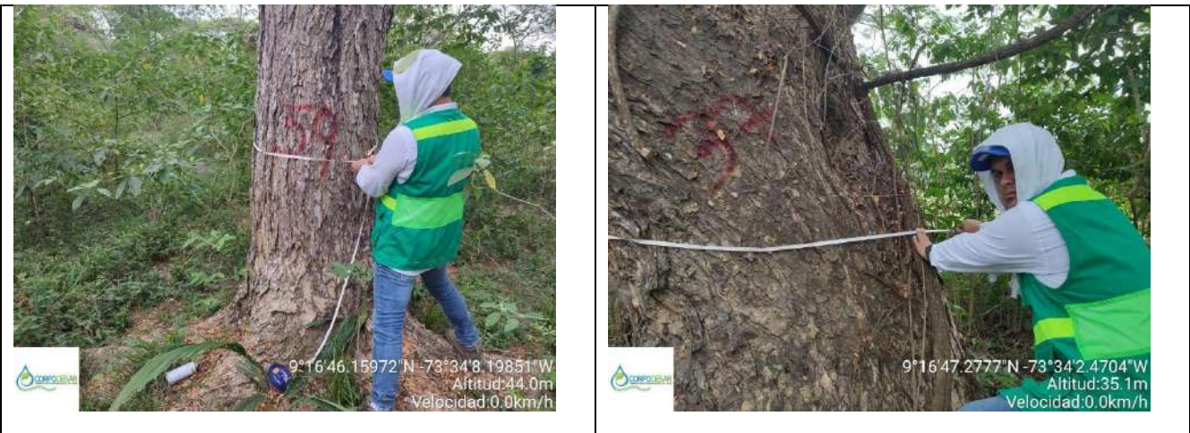
Fotografía 19 y 20 árboles de la especie Campano (Samanea Samán), ubicado en la Finca Parcela 18 ubicado en la vereda Nueva Granada en jurisdicción del Municipio de Curumani – Cesar.