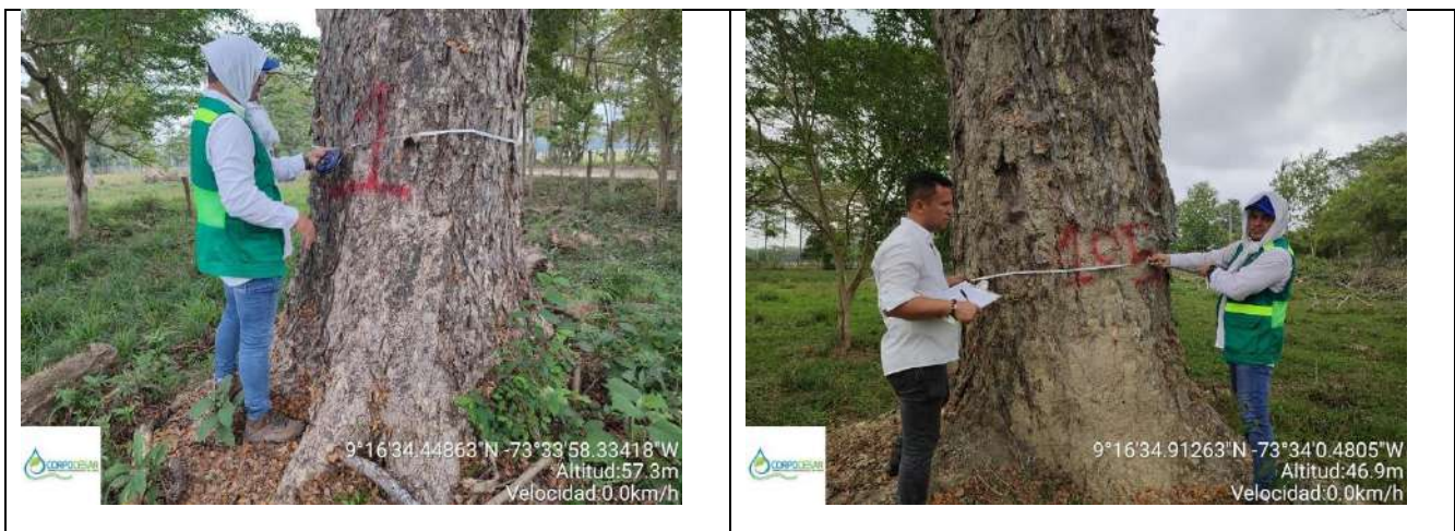
Fotografía 7 y 8 árboles de la especie Campano (Samanea Samán), ubicado en la Finca Parcela 18 ubicado en la vereda Nueva Granada en jurisdicción del Municipio de Curumani – Cesar.