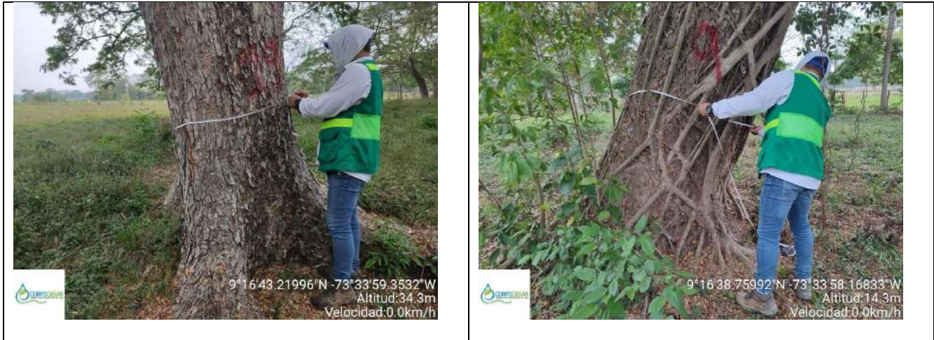
Fotografía 5 y 6 árboles de la especie Campano (Samanea Samán), ubicado en la Finca Parcela 18 ubicado en la vereda Nueva Granada en jurisdicción del Municipio de Curumani – Cesar.