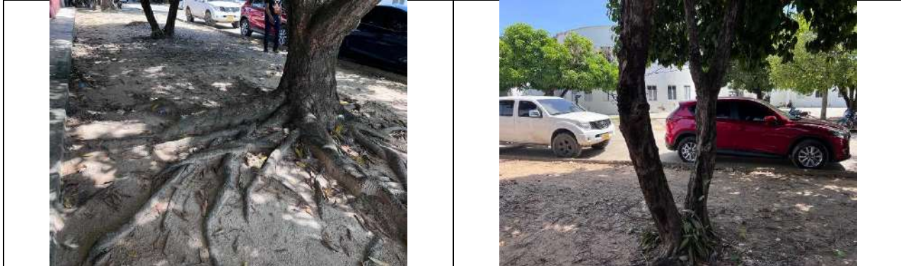
Árboles con raíces brotadas Para intervenir con tala y poda de la especie Mango ( Mangifera indica ) con ramas extendidas sobre la sobre la calle 7 frente a l Palacio Municipal y Unidad de Víctimas.