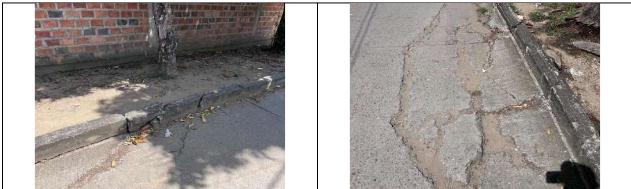
Árboles de las especies Maíz tostado ( Coccoloba acuminata ) y Oití ( Licania tomentosa ) con raíces levantando lozas de concreto y bordillos sobre la carrera 16 frente al Centro de Desarrollo Infantil Curumaní – Cesar.