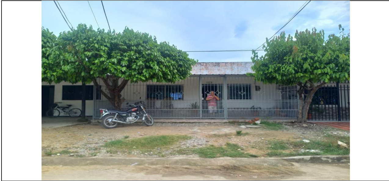
Tabla 1 Especies y cálculo de volúmenes de los árboles a intervenir con tala en la calle 7 N° 11-02 del Barrio La Trini del Municipio de Curumaní – Cesar.