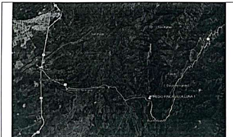
IMAGEN 12: Finca Villa Luna 1 ubicado en jurisdicción del municipio de Río de Oro, Cesar