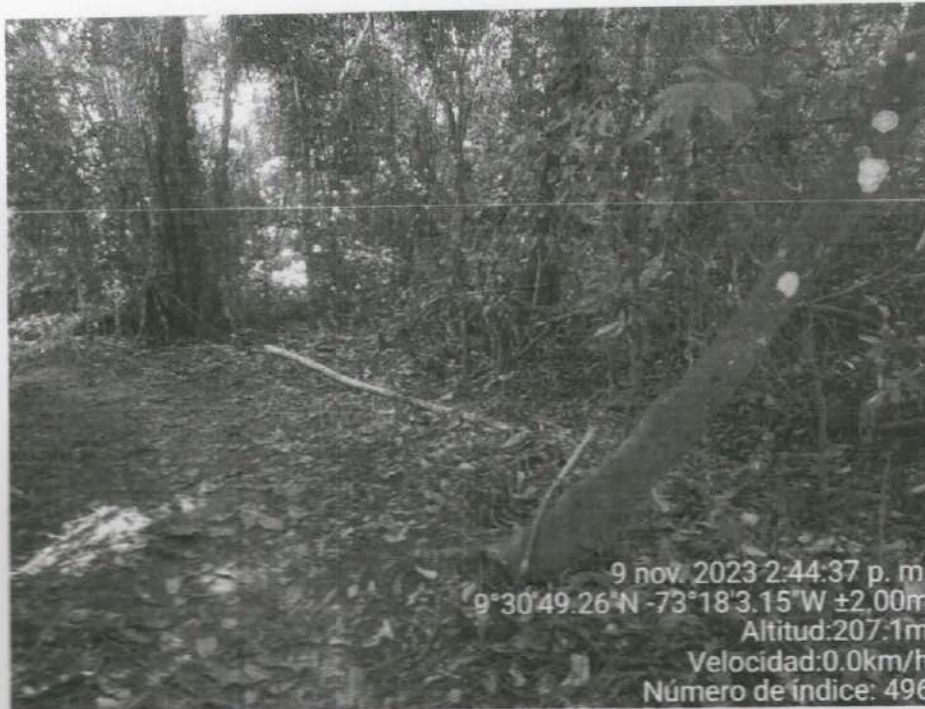
Imagen 4. Árbol de Piñón ubicado en vía improvisada por el parcelero

Continuación Resolución No. "Por medio de la cual se niega permiso a La Alcaldía Municipal de La Jagua de Ibirico, con Identificación tributaria No. 800108683-8 para efectuar tala de un (01) árbol aislado dentro de la cobertura de bosque natural en terreno de dominio público, en ronda hídrica del río Sororia y dentro de zona de reserva establecida por la ley segunda de 1959, a la altura de la vereda San Isidro, Municipio de La Jagua de Ibirico - Cesar" ----- 4