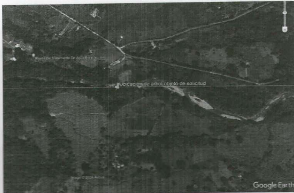
Imagen 2: Ubicación del árbol con respecto a la ronda hídrica del río Sororia