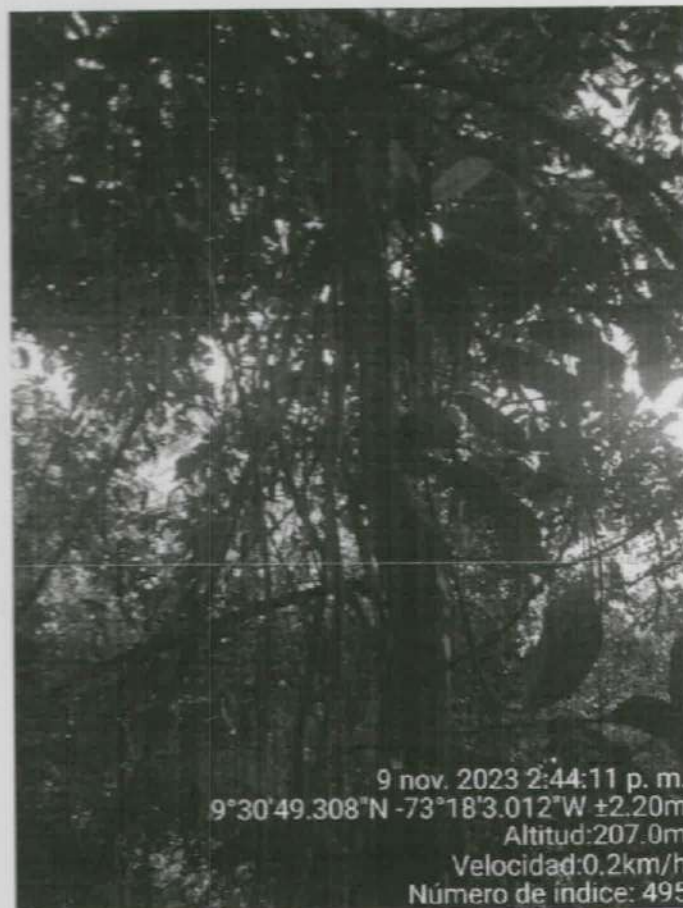
Imagen 5. Dosel del árbol objeto de solicitud y la vegetación circundante