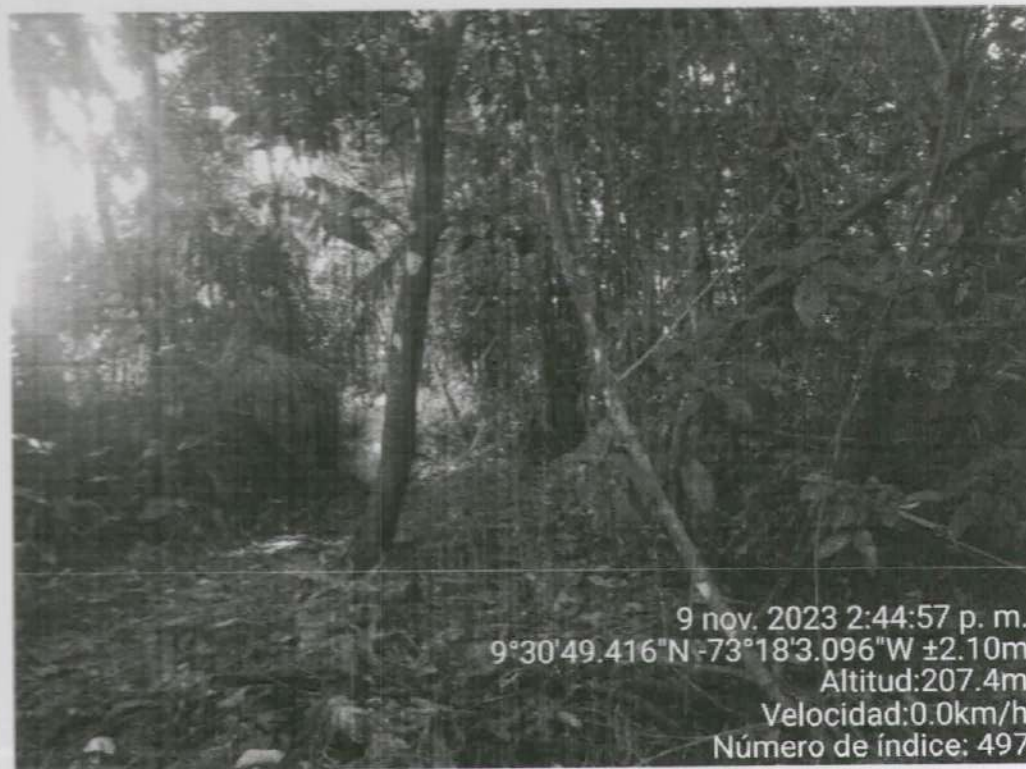
Imagen 3. Árbol de Piñón ubicado en vía improvisada por el parcelero