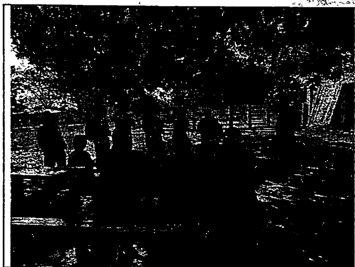
IMAGEN 2. Evidencia de la reunión con los actores y servidores públicos de las diferentes dependencias administrativas de la Alcaldía del municipio de San Martín - Cesar.

A continuación, se ilustra el registro fotográfico evidenciado como insumo visual durante la atención a la denuncia ambiental en estudio: