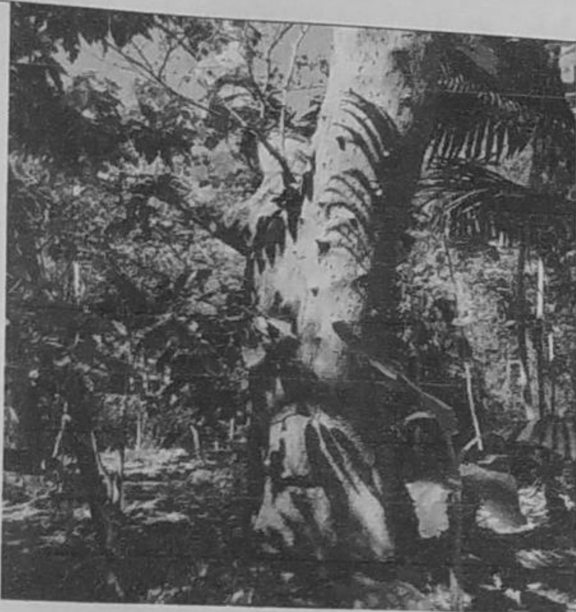
Imagen 1. Árbol de la especie campano totalmente seco