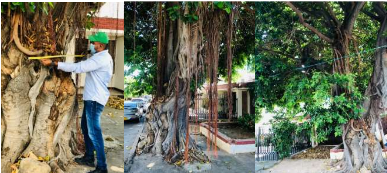
Características de los árboles a intervenir un (1) árbol de la especie Caucho nombre común, (Hevea brasiliensis) nombré científico, ubicado en la calle 13c No 17-95 en jurisdicción de Valledupar-Cesar.