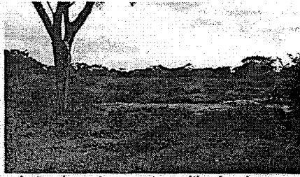
Lotes de pastoreo, antes cultivados de arroz

En la actualidad en el predio La Playa se desarrolla la ganadería, y los lotes destinados para tal fin se encuentran con cobertura de pastos y vegetación arbórea dispersa y de diferente estado de desarrollo, acorde a la actividad que se desarrolla; también se observó que los canales de conducción y distribución de las aguas se encuentran sedimentados y enmalezados.