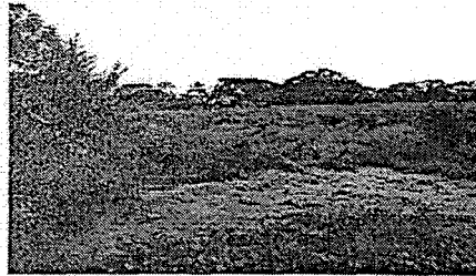
Estado de los canales de distribución