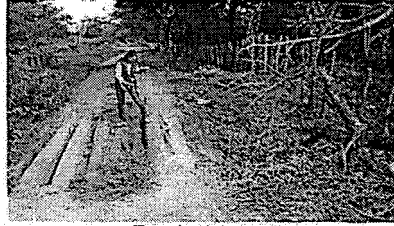
Estado del canal

En la actualidad en el predio La Playa se desarrolla la ganadería, y los lotes destinados para tal fin se encuentran con cobertura de pastos y vegetación arbórea dispersa y de diferente estado de desarrollo, acorde a la actividad que se desarrolla; también se observó que los canales de conducción y distribución de las aguas se encuentran sedimentados y enmalezados.