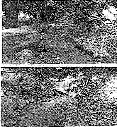
Canal proveniente de los Sobrantes de la Planta de Emdupar.

Durante la diligencia técnica de control y seguimiento ambiental, se pudo evidenciar canal en tierra totalmente seco, cabe manifestar que no se observó ningún tipo de cultivo que requiera del recurso hídrico para riego, ni se evidencia trazado o derivación de canales para tal fin.