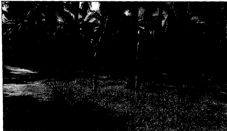
Cultivo de Palma Predio Tocaloa.

El predio denominado finca Tocaloa, no cuenta con ningún tipo de infraestructura representativa del predio tales como casa de habitación, oficinas, talleres, etc., solo se observa el cultivo de palma aceitera.