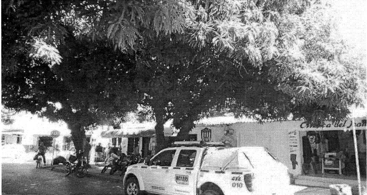
Tabla 1.- Especie y cálculo de volumen de los árboles - Calle 21 No. 6 – 31, barrio San Jorge de la ciudad de Valledupar