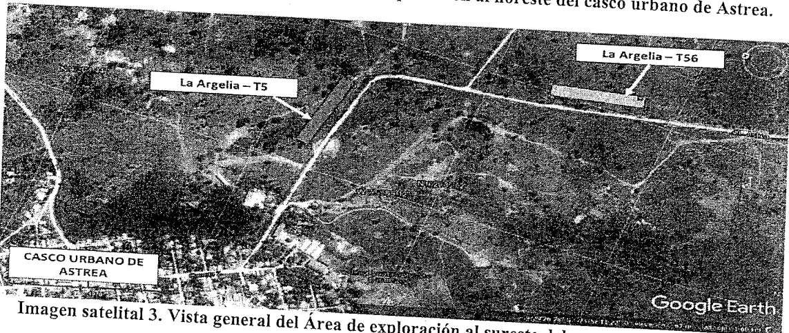
Imagen satelital 3. Vista general del Área de exploración al sureste del casco urbano de Astrea.

Así, la exploración se llevará a cabo al interior de los polígonos a que se ha hecho referencia.