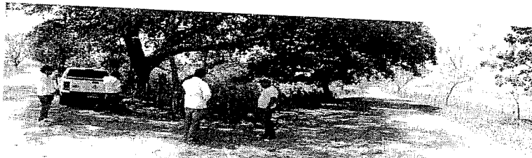
Fotografía 1. Sector de la zona en que se pretende adelantar la exploración en busca de agua subterránea, en inmediaciones de los predios La Fortuna y Flor del Monte.

El aspecto de las zonas de interés para la exploración se observa en las Fotografías No. 1 a 4 incluidas en el presente concepto, tomadas el día de la diligencia de inspección, mientras que las Fotografías 5 a 7 ilustran las vías en que se propuso inicialmente la exploración, sobre lo que la Corporación advirtió al usuario debe abstenerse.