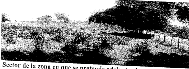
Fotografía 2. Sector de la zona en que se pretende adelantar la exploración en busca de agua subterránea, en inmediaciones de los predios La Fortuna y Las Mercedes