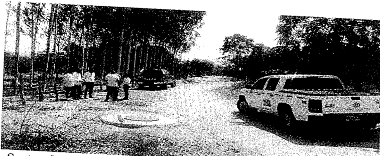
Fotografía 7. Sector de la zona en que se prohíbe adelantar la exploración en busca de agua subterránea, en inmediaciones de la Carrera 5E entre Calles 1 Norte y Siete