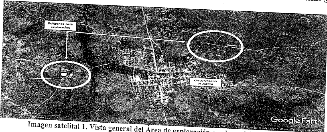
Imagen satelital 1. Vista general del Área de exploración en el municipio de Astrea.