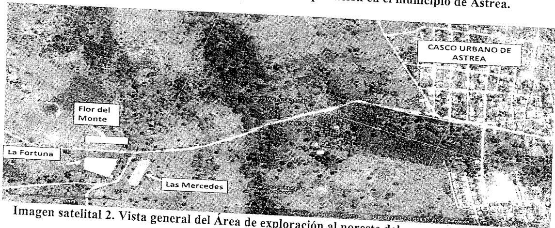
Imagen satelital 2. Vista general del Área de exploración al noreste del casco urbano de Astrea.