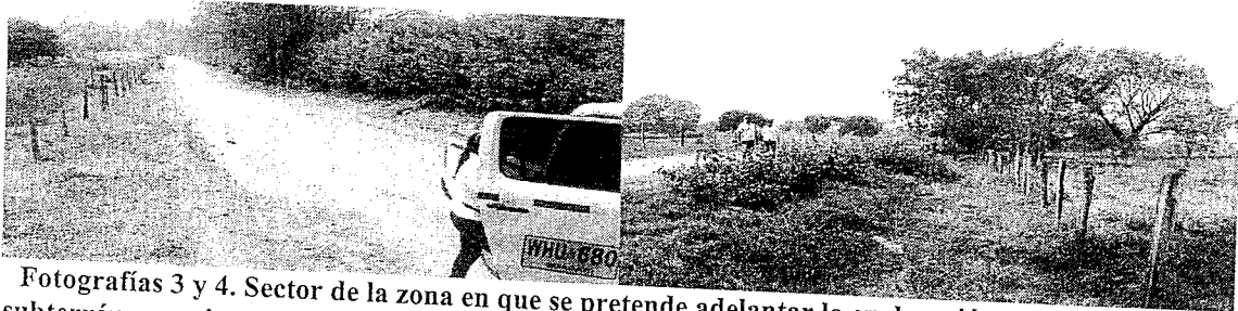
Fotografías 3 y 4. Sector de la zona en que se pretende adelantar la exploración en busca de agua subterránea, en inmediaciones de los predios La Argelia (a la derecha en las fotos). En la vía que se observa al centro e izquierda se prohíbe la exploración.