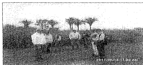
Foto 2. Acompañamiento del peticionario