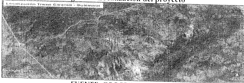
Figura 1. Localización del proyecto

de la cual se otorga autorización para la ocupación de cauce de cruces subfluviales de corrientes naturales y/o artificiales, con el fin de realizar trabajos de ampliación de la red de distribución de gas natural en la margen derecha del ancho de vía, Tramo Caracol-Guaimaral, en jurisdicción del municipio de Valledupar - Cesar, a GASES DEL CARIBE S.A. E.S.P., con identificación tributaria N° 890.101.691-2.