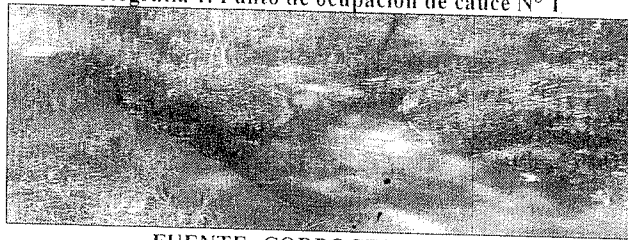
Fotografía 1. Punto de ocupación de cauce N° 1

Para la presente evaluación, se pretende realizar intervención sobre cruces subfluviales de corrientes artificiales, que en su mayoría corresponden a alcantarillas, en algunos casos cuerpos de agua innominados de poco flujo y en otras empozamientos causados por las condiciones del terreno.