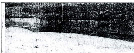
Socavación en la pata de los gaviones