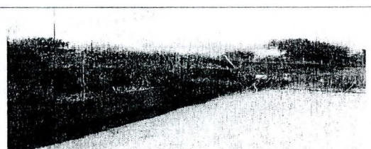
Socavación en la pata de los gaviones