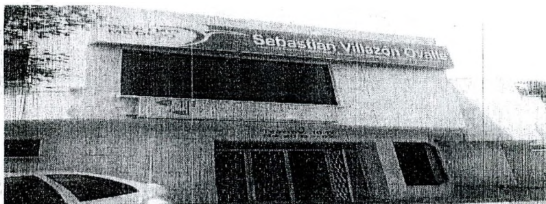
Fotografía 1. Centro medico Sebastián Villazón Ovalle

El centro médico Sebastián Villazón Ovalle es una institución de salud ubicada en una edificación de dos pisos, en el cual se realiza la prestación de servicios de consulta externa en medicina general y especializada; también se realizan procedimiento de cirugías ambulatorias programadas menores y apoyo diagnóstico y complementación terapéutica.